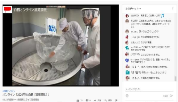
△昨年のオンラインイベントの様子

また関連企画として、例年の酒蔵開放で大好評の福袋を予約販売し、遠方の方からご要望の多かったオンラインショップ専用の福箱も販売します。