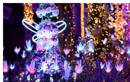
イルミネーション点灯時の様子