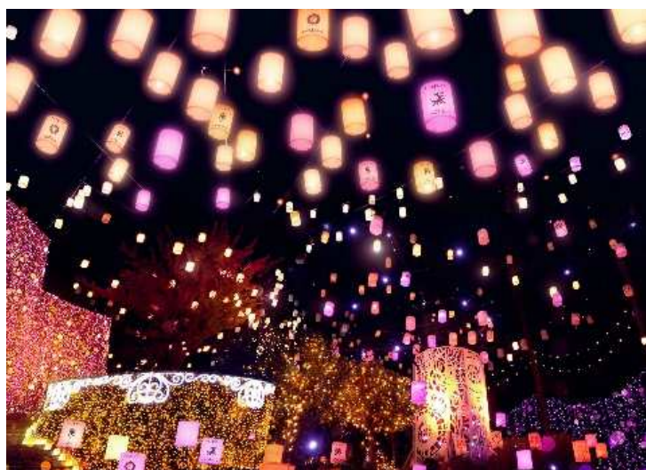
「光のランタン広場」イメージ