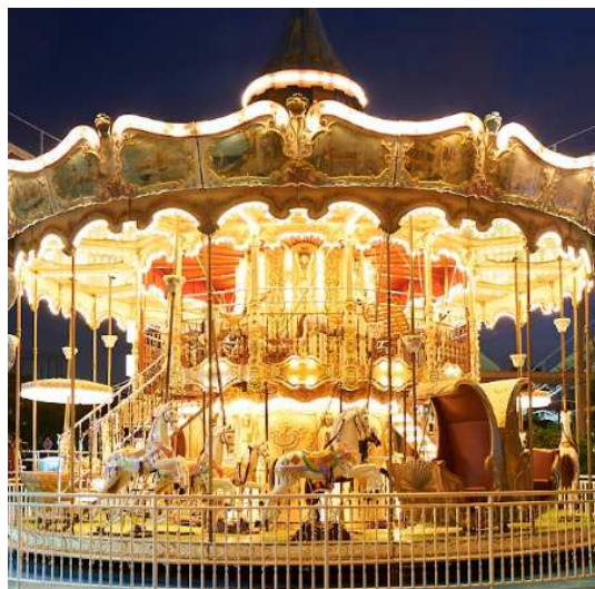
ナイトアトラクションイメージ