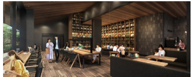
カフェラウンジ・ライブラリーラウンジ完成予想図