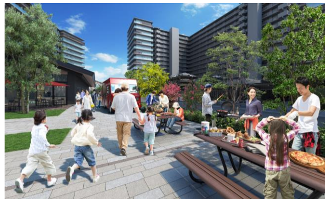
バーベキュースペース完成予想図