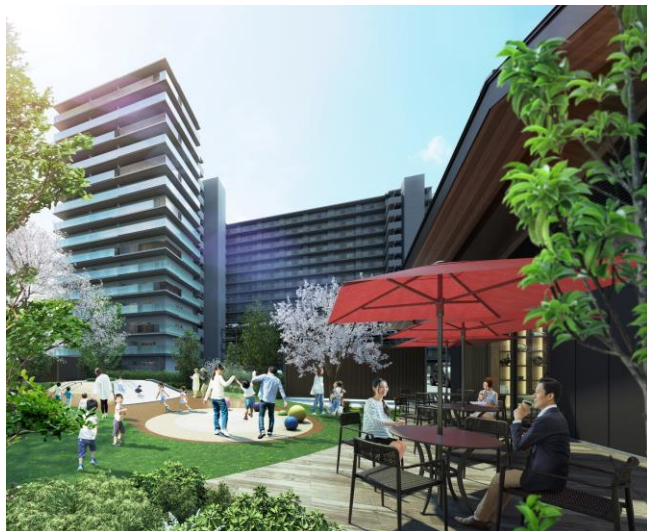
プレイグラウンド完成予想図

冒険心を刺激する手すりパイプやクライミングホールドなどを設け、足元は安心なゴムチップ素材を使ったマウントとするなど、安全に配慮しながら自由に遊べる空間を実現しました。