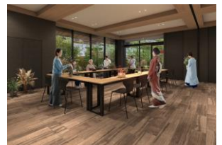
カルチャールーム完成予想図