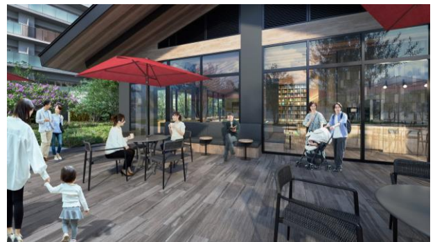
センターハウス完成予想図

布団やシーツ類など大型の洗濯物や一度に大量に洗濯したい時に便利な大型ランドリーを4台設置。24時間ご利用が可能です。