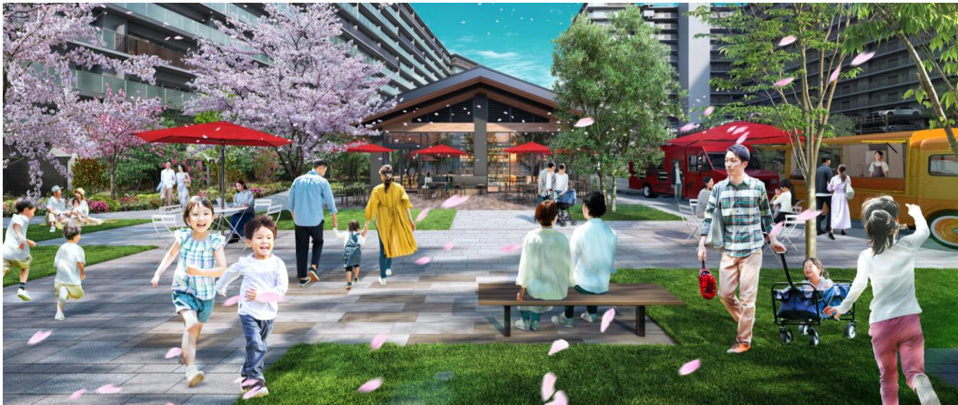
センタープラザ完成予想図