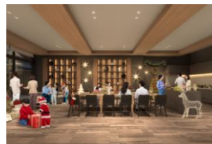
パーティールーム完成予想図