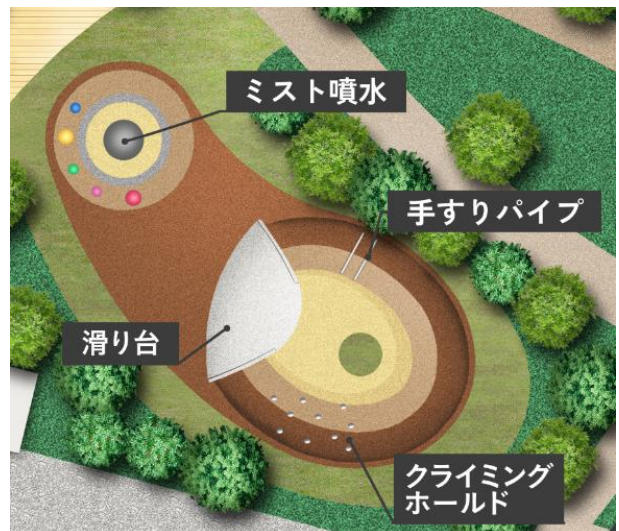
プレイグラウンド概念図