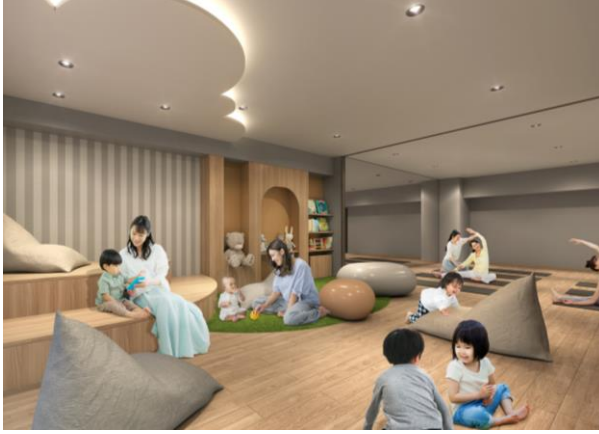
キッズベース完成予想図

小さなお子さまが元気いっぱい遊べる屋内スペース。 子どもたちに目が届くので安心でき、新しいお友だちとの出会いや、大人同士の情報交換の場にもなります。 また、多目的に使えるマルチスタジオの壁面は鏡張りとなっており、ヨガやダンス等のレッスンにも最適です。