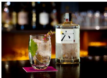
【七福ジントニック イメージ画像】