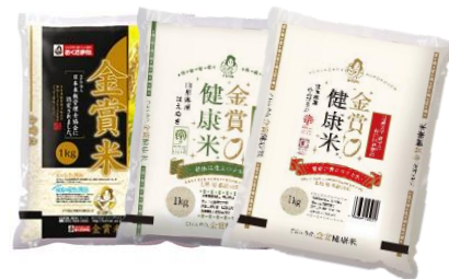
【米俵 イメージ画像】