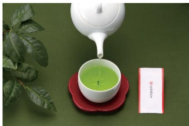
【茶柱縁起茶 イメージ画像】