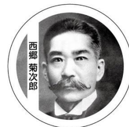
ヘッドマークイメージ