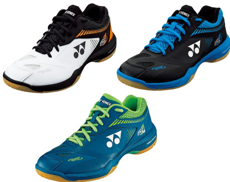
[左上から時計回りに]POWER CUSHION 65 Z 2[ホワイト/オレンジ]、[ブラック/ブルー]、 POWER CUSHION 65 Z 2 WIDE[ダークマリン]