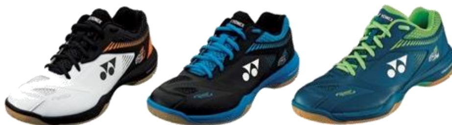
(左から)POWER CUSHION 65 Z 2[ホワイト/オレンジ][ブラック/ブルー]、 POWER CUSHION 65 Z 2 WIDE[ダークマリン]