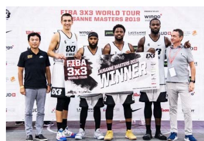
NY Harlem (アメリカ)