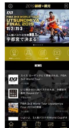
スマートフォン「3x3 専用アプリ」イメージ図