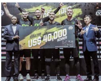
FIBA 3x3 World Tour Beijing Final 2018の様子

※1) 日本は開催国枠として、男女いずれか FIBA ランキング上位チームの出場が決定します。