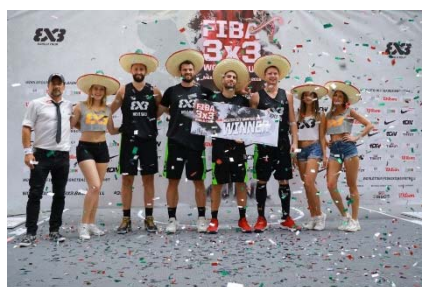
Novi Sad (セルビア)