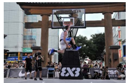
FIBA 3x3 World Tour Utsunomiya Masters 2018の様子