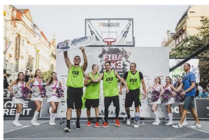
Riga Ghetto (ラトビア)