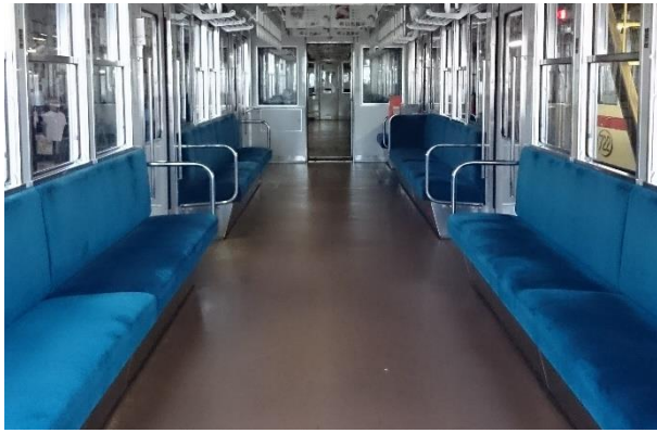
ロングシート車（800系）車内