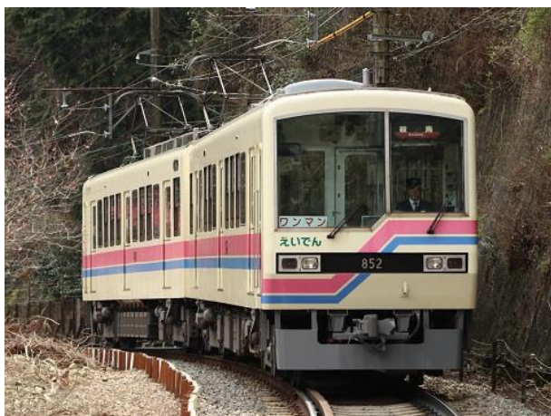
ロングシート車(800系)外観