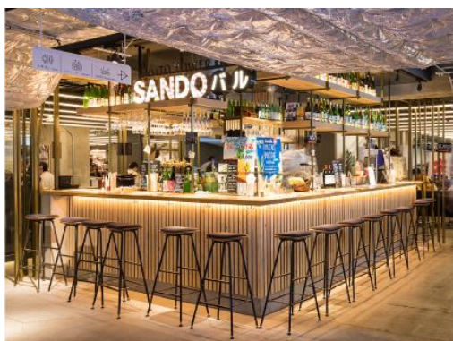
国内外の様々なお酒が楽しめるバル

昼はランチや観光の拠点として、夜はお酒とともに語らう場所として、時間帯によって表情を変えるこのFOOD HALLで、食事の合間にふと作品に目が留まり、会話のきっかけが生まれるような、 心はずむ文化体験 をつくり出します。