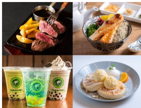
FOOD HALLで楽しめるフードの数々