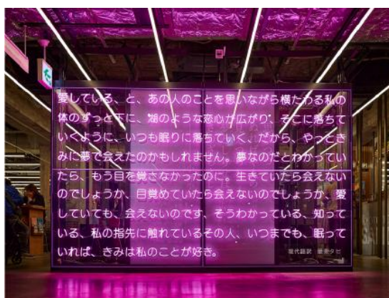
FOOD HALLに常設されている詩人・最果タリ氏とコラボしたパブリックアート

京都の未来を担う学生の作品を、観光客が最初に出会う「京都の玄関口」で展示することで、卒業後のアーティスト活動につながる露出機会をつくとともに、来場者にとっては<京都の文化の未来>に触れられる場を提供します。