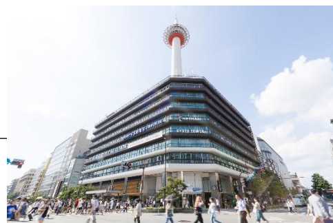
京都駅すぐの「京都タワーサンド」から文化を発信していきます

展示を通じて、若手アーティストと地域の人々・観光客が出会い、 京都が継続的に才能を育てていくための土壌 づくりを目指します。