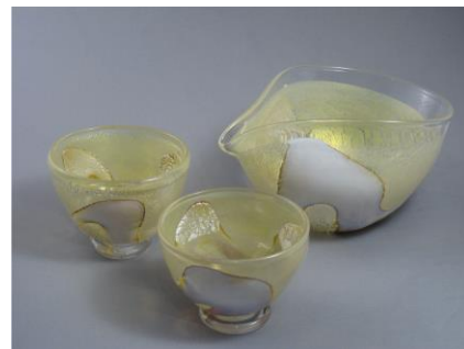
「風紋冷酒片口 お猪口 白」