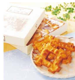
東急百貨店吉祥寺店