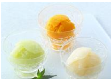
〈宗家 源 吉兆庵〉

[取り扱い店舗]本店、東横店、日吉東急アベニュー、武蔵小杉東急フードショースライス