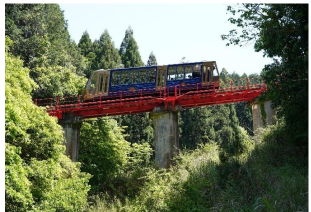
▲日本一長い坂本ケーブル