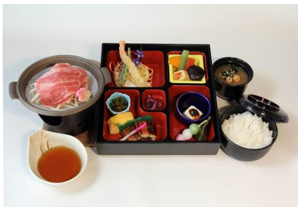
▲峰道レストランのお食事 (イメージ)