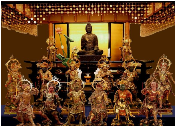
▲十二神将 (国宝殿)※イメージ