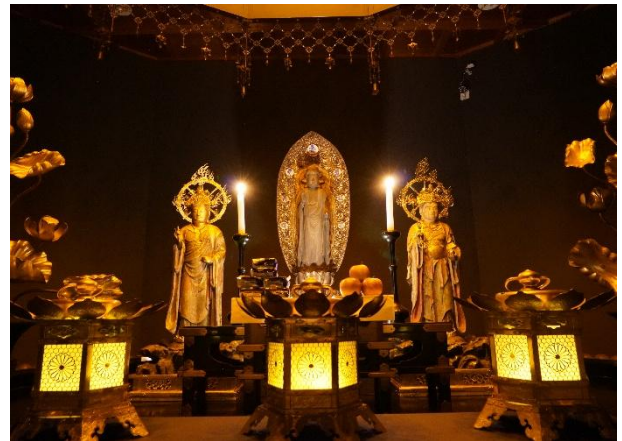
▲1200年灯り続ける不滅の法灯 (萬拝堂)