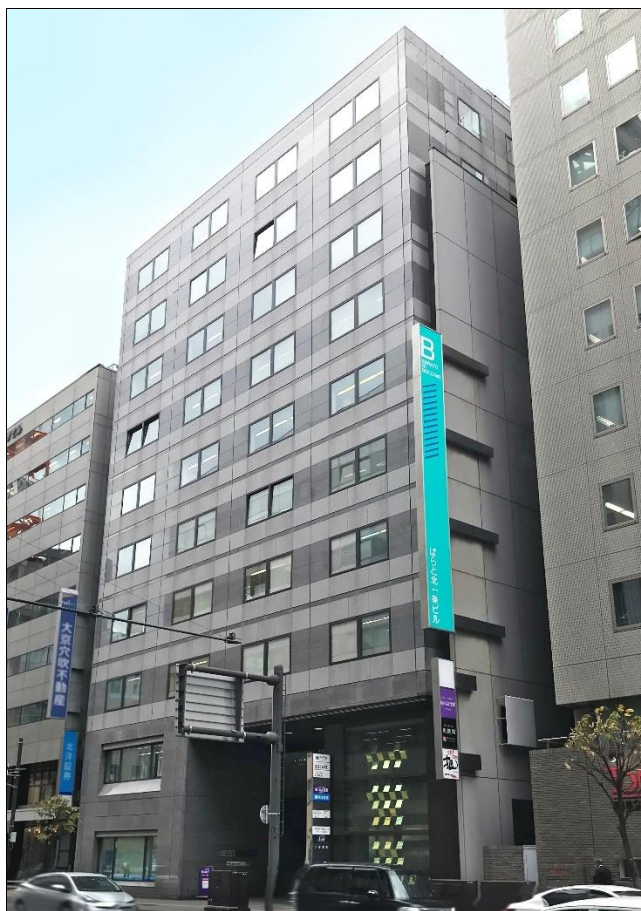
ばらと北一条ビル 9F に札幌セールスオフィスを新設