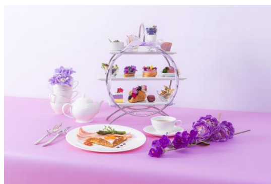
Violet Flower Afternoon Tea

ドリンクはフリードリンクにて、コーヒー、紅茶、ハーブティーなど、ソフトドリンク7種をご用意しております。