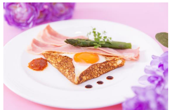
<ウェルカムプレート>クレープパルマンティエ ベーコン添え

初夏の陽光に美しく映える「紫」をテーマに、可憐な花々を添えた「ブルーベリーのムース」や「ブルーベリーのクロワッサンサンド」などのスイーツメニューに加え、クレープ生地に卵を包みベーコンを添えた「クレープパルマンティエ ベーコン添え」をウェルカムプレートとしてご用意いたします。そのほかにも「筍のチーズ焼き」などセイボリーが揃う優雅なティータイムを、ぜひお楽しみください。