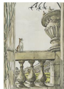
「魅せられし河より パレ・ロワイヤル」

東京生まれ。東京美術学校西洋画科卒。1955年にフランス国籍を取得。 洗礼名はレオナール。