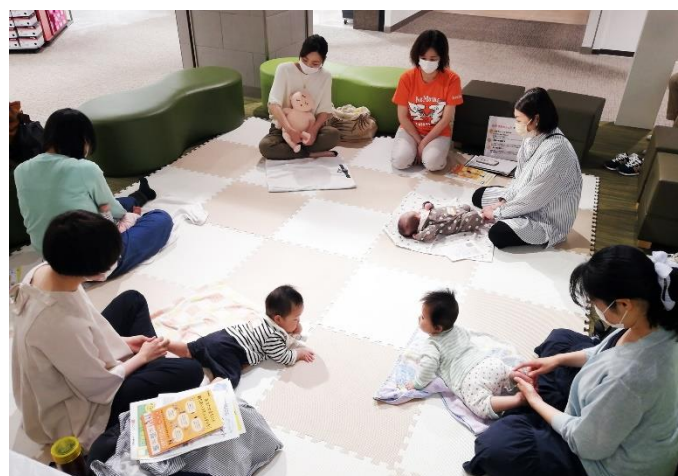
子育てイベントの様子