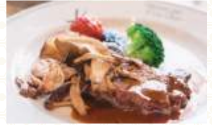
レストランカフェ Elle Bon