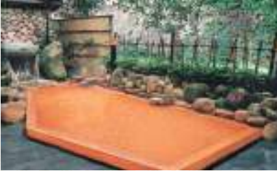
月光園 鴻臚館・游月山荘