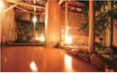
有馬ロイヤルホテル