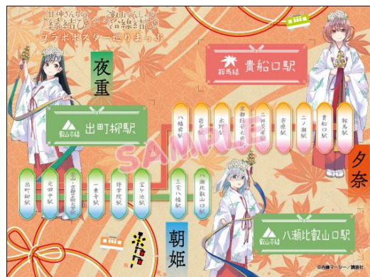
一日乗車券のイメージ