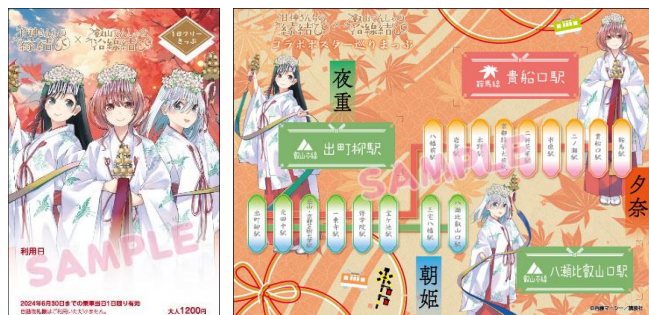
コラボきっぷのイメージ