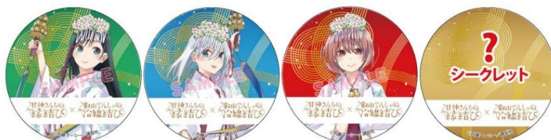
コラボ缶バッジのイメージ