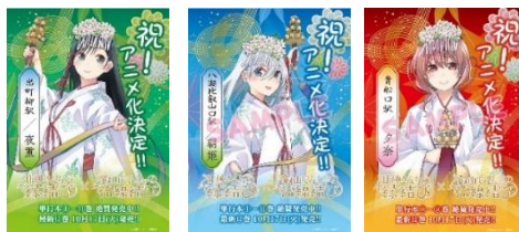
コラボポスターのイメージ