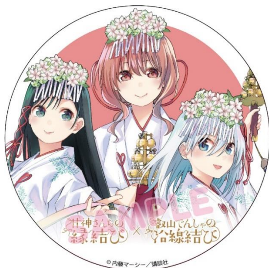
コラボヘッドマークのイメージ

期間中は、キャラクターのイラストを使用したコラボヘッドマークの掲出運行、コラボポスターの掲出や「コラボきっぷ」「コラボ缶バッジ」などのグッズ販売、キャラクタースタンディPOPの設置、「甘神さんちの縁結び」イベントヘッドマーク掲出運行企画の実施など、様々な取り組みを行ってまいります。詳細は別紙をご覧ください。