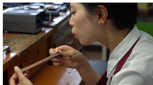
手で引き伸ばし、美しい曲線を作る技法「蜜蝋」