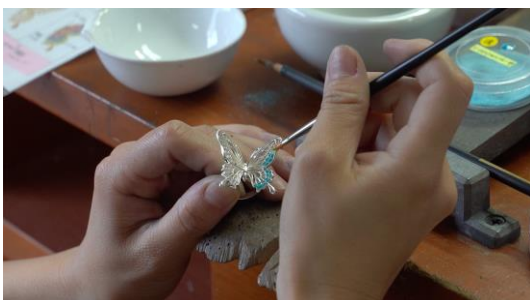
釉薬をのせて、炉で焼成して表現する技法「七宝」