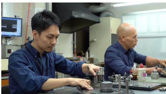
世界最高評価の輝きを生む「ダイヤモンド研磨」