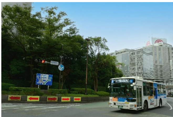
「上菅田東部公園線」を運行する予定の 相鉄バス車両（イメージ）