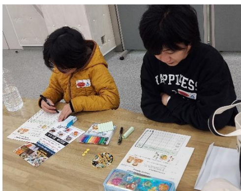
選考するためにワークシートに記入している様子

午前・午後の回とも早々と満席となり、合計 40 組 100 名以上が参加した投票結果とクラウドファンディング「GiFU SPACE FOOD CHALLENGE」での Web 投票権付返礼品による投票結果を合わせ、3 月上旬に申請する候補 3 品を決定します。選抜結果はクラウドファンディングの「活動レポート」および宇宙博ホームページ（予定）にて発表いたします。