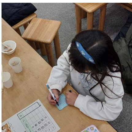
宇宙日本食認証に取り組むスタッフへのメッセージを書いている様子