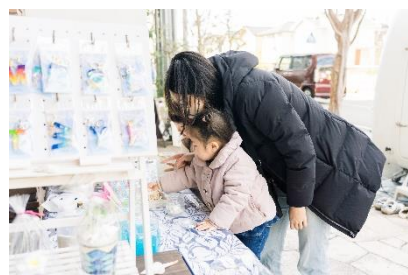
まちなね手づくりマルシェ