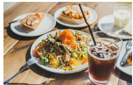
コミュニティカフェのメニュー