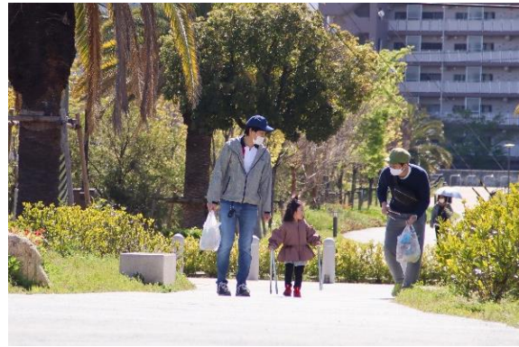
まちピカ大作戦（月2回） 西宮市公園緑地課より公園清掃管理業務を受託し、浜甲団地公園のゴミ拾いを住民と実施。