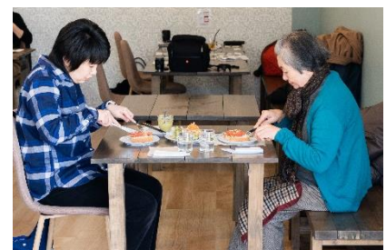
コミュニティカフェ営業の様子