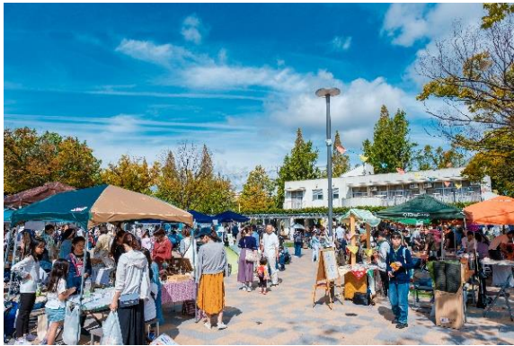
まちなねピクニック（年1～2回） ブース運営とステージ公演でにぎわう、屋外マルシェイベント。