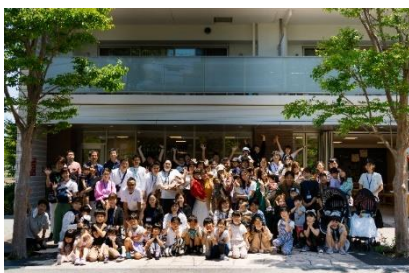
転入者の交流会（ウェルカムパーティー）