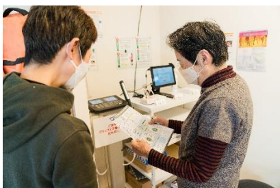
健康ポイント事業（西宮市主催）