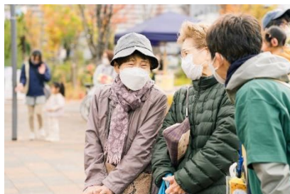
まちなねピクニック（多世代交流）