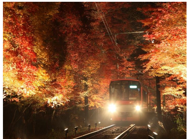
もみじのトンネル