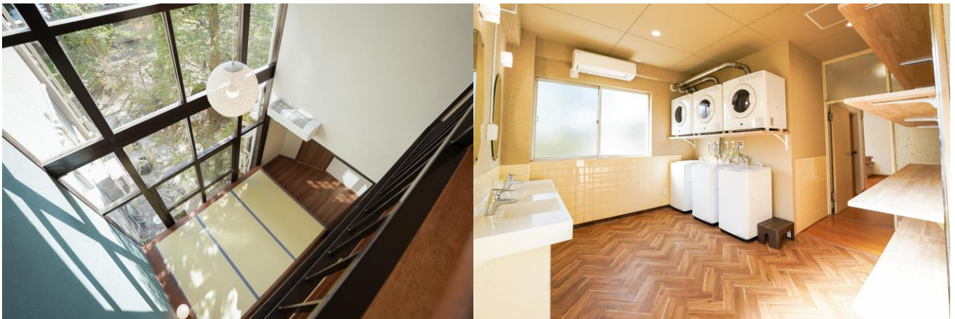
吹き抜けの茶の間スペース