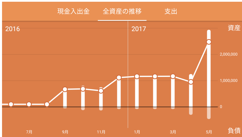
全資産の推移グラフ