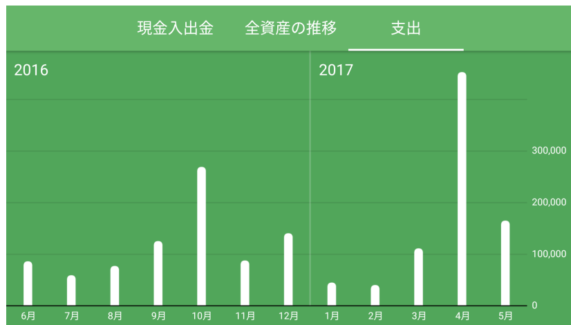
支出の推移グラフ