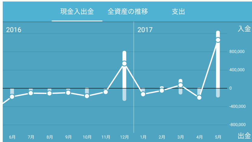
現金入出金の推移グラフ