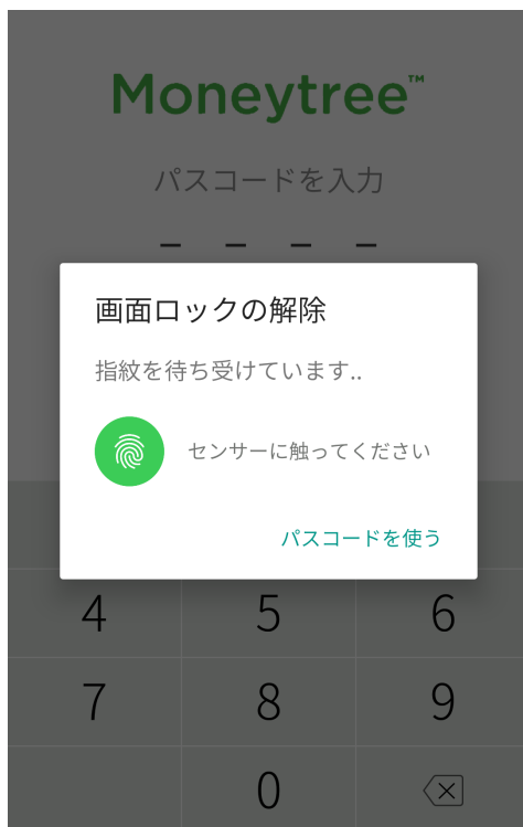
指紋認証によるパスコードロック解除画面

2) 登録済みの指紋認証を用いて、Moneytreeログイン時のパスコードロックを解除できるようになりました。ただし、ご利用のデバイスが指紋認証を用いたパスコードロック解除をご利用いただける場合に限り ます。バージョン1.1.7 (Android 4.4以上対応)