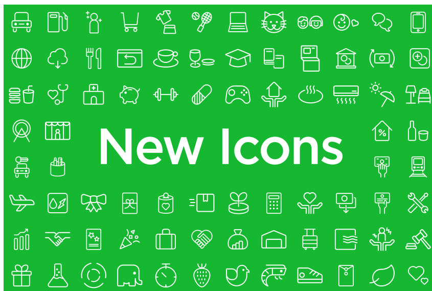
カテゴリーアイコンの種類・iOS版とAndroid版

今後もより多くのMoneytreeのご利用者の方が、お金の管理をより身近に感じていただけるよう、順次対応 機能を拡充してまいります。