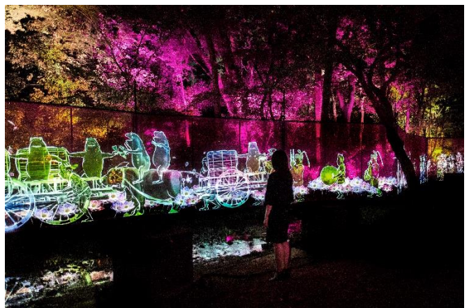
チームラボ「下鴨神社 糺の森の光の祭 Art by teamLab - TOKIO インカラミ」下鴨神社 糺の森 京都。チームラボ