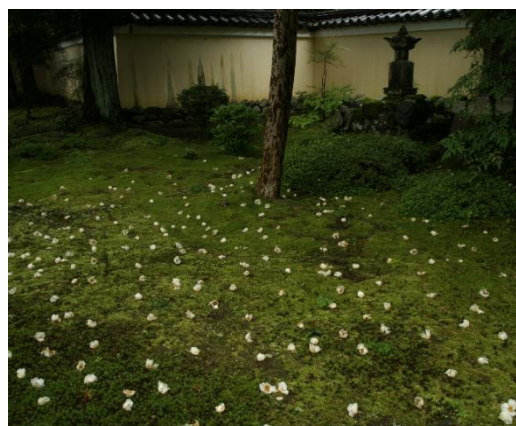
沙羅双樹の花（鹿王院庭園）

嵐電は今年 3 月 25 日に西院で阪急電鉄京都線との結節・バリアフリー工事が完了しました。アクセスが便利になった阪急沿線の皆さまをはじめ、普段、体験することのできない内容の沿線巡りで、更に「奥深い京都」をお楽しみいただくください。