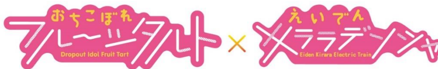
コラボロゴのイメージ

全ての企画には、「おちこぼれフルーツタルト×えいでんキララデンシャ」コラボロゴを使用します。