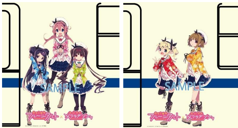
車体ラッピングのイメージ