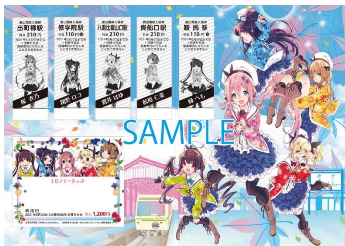
コラボきっぷのイメージ