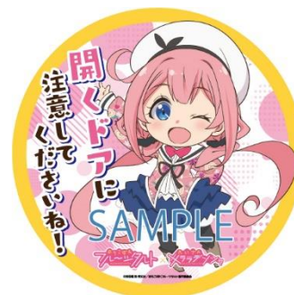
ドア注意喚起ステッカーのイメージ