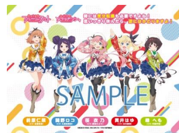
車内ラッピングのイメージ