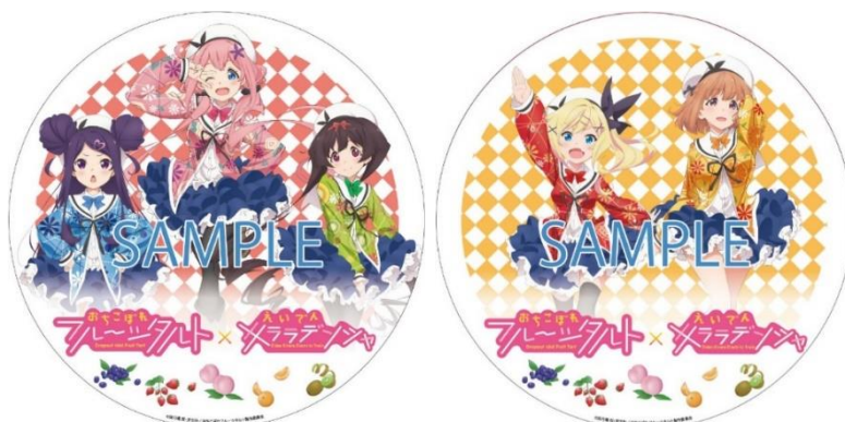
ヘッドマークのイメージ