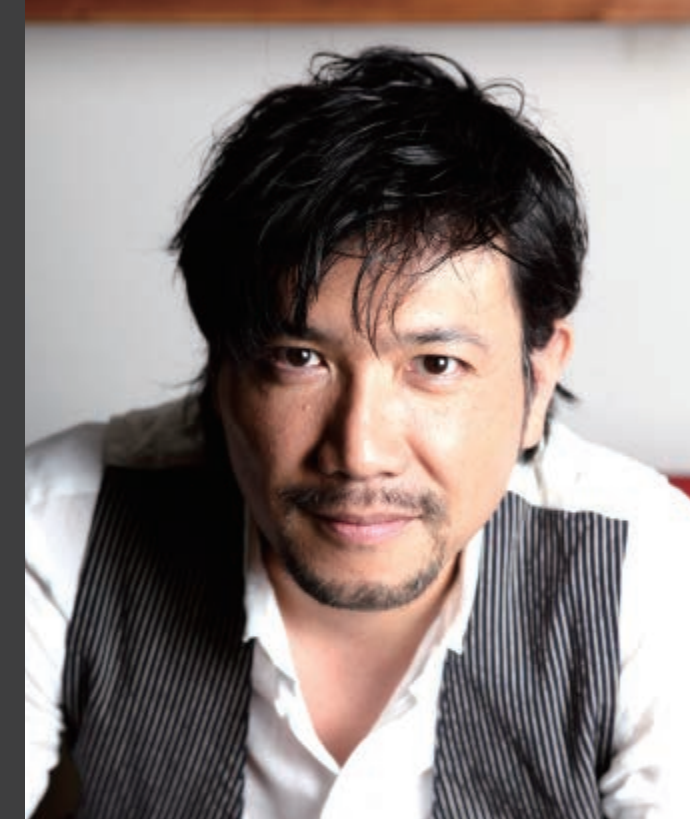
ショートショートフィルムフェスティバル & アジア 代表