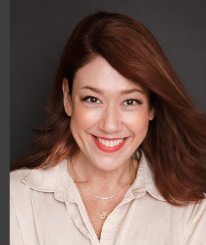
ショートショートフィルムフェスティバル & アジア フェスティバルディレクター