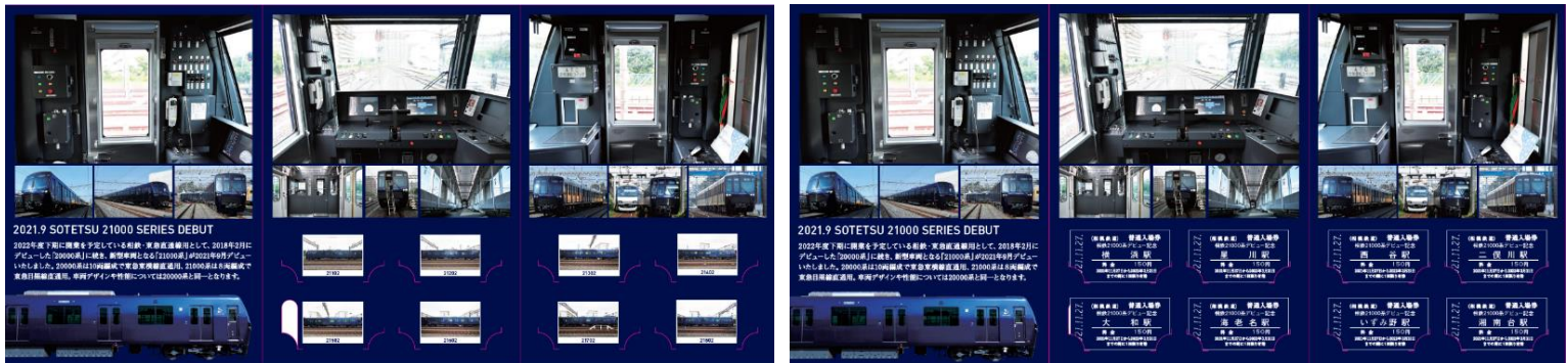
「相鉄 21000 系デビュー記念入場券セット」展開時 中面 (左)、中面 硬券挿入時 (右) (イメージ)