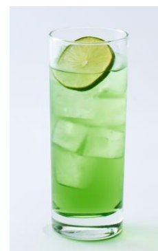
つばめの ぐりーんパーカッション