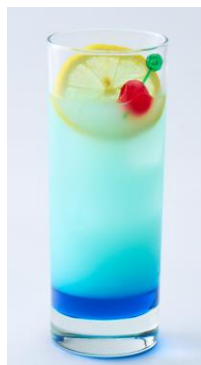
葉月の ぶるーチューバ