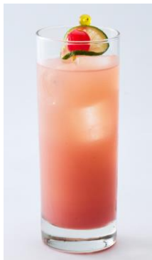
久美子の びんくユーフォニアム