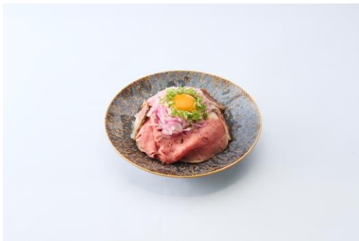
・アンサンブルローストビーフ丼 1,700円