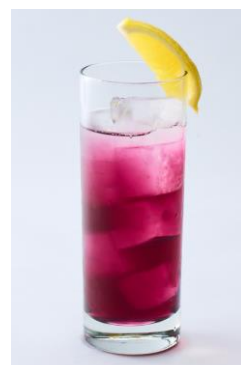
麗奈の ぱーぶるトランペット