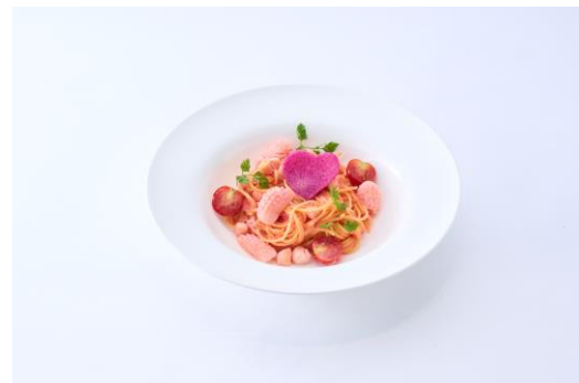
・ホルンちゃんの明太クリームパスタ 1,400円