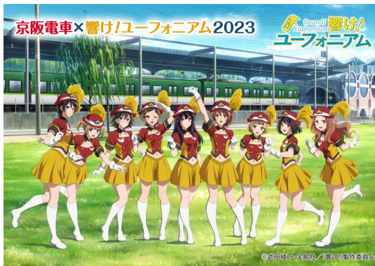
「京阪電車×響け！ユーフォニアム 2023」オリジナル描き下ろしイラスト