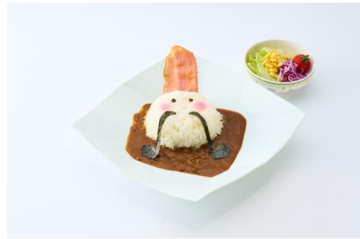
・コンパスくんのカレー（ミニサラダ付）1,500円