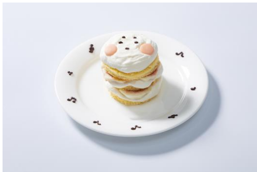
・響け！チューバくんフルーツケーキ 1,400円 ※大好評につき、再登場！