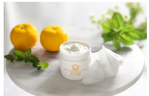
「とろみ和洗顔 柚子」100g 2,178円 (嵐山桃肌こすめ)