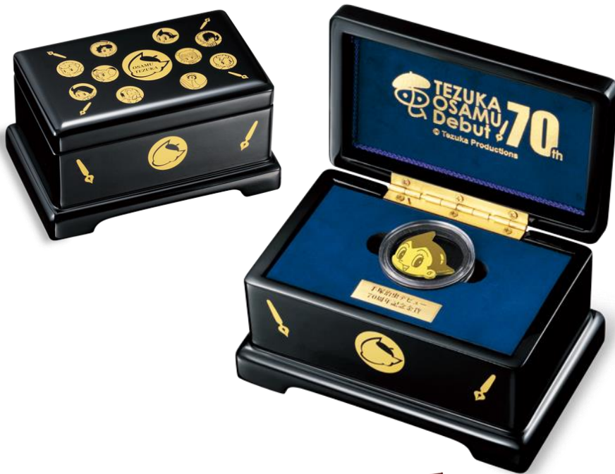
【金貨セット／700 点限定】