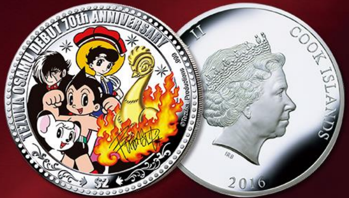
【銀貨セット】 限定 5,000 点発行