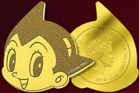
【金貨セット】 限定 700 点発行