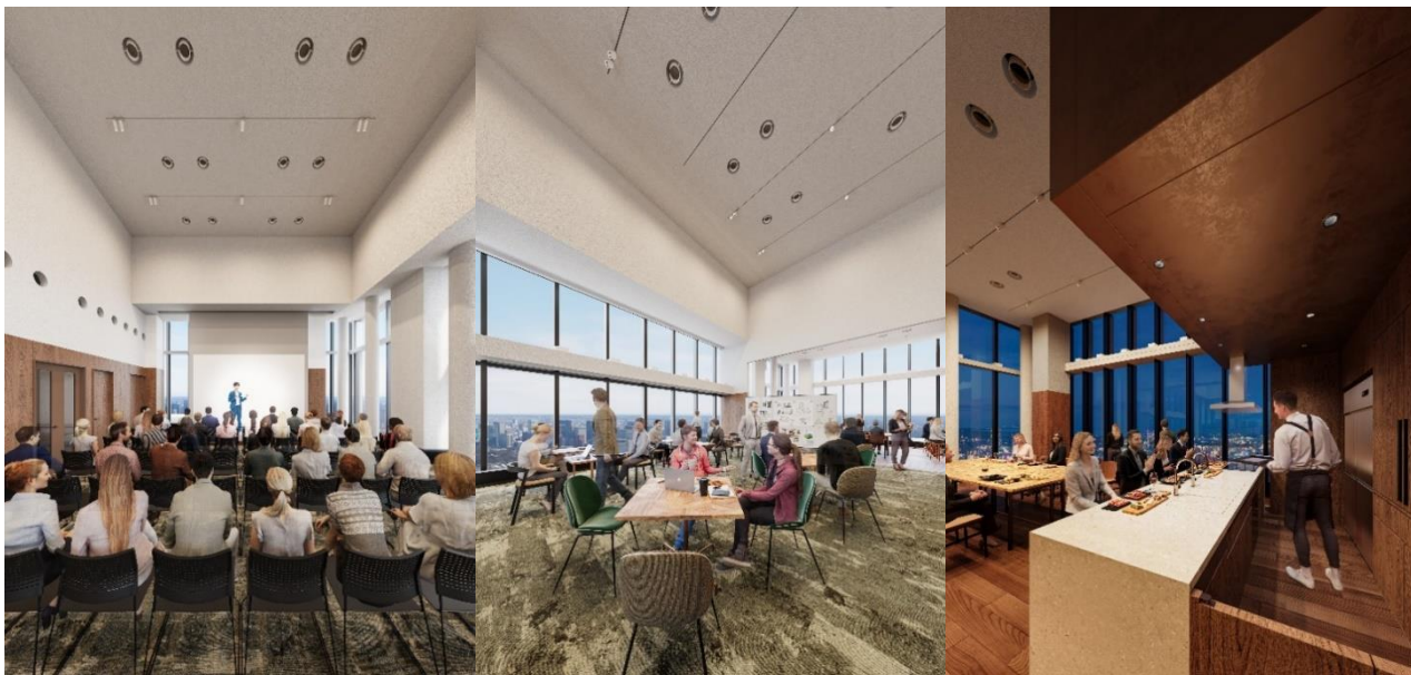
▲イベントスペース「Vlag yokohama Hall&Studio」（イメージ）