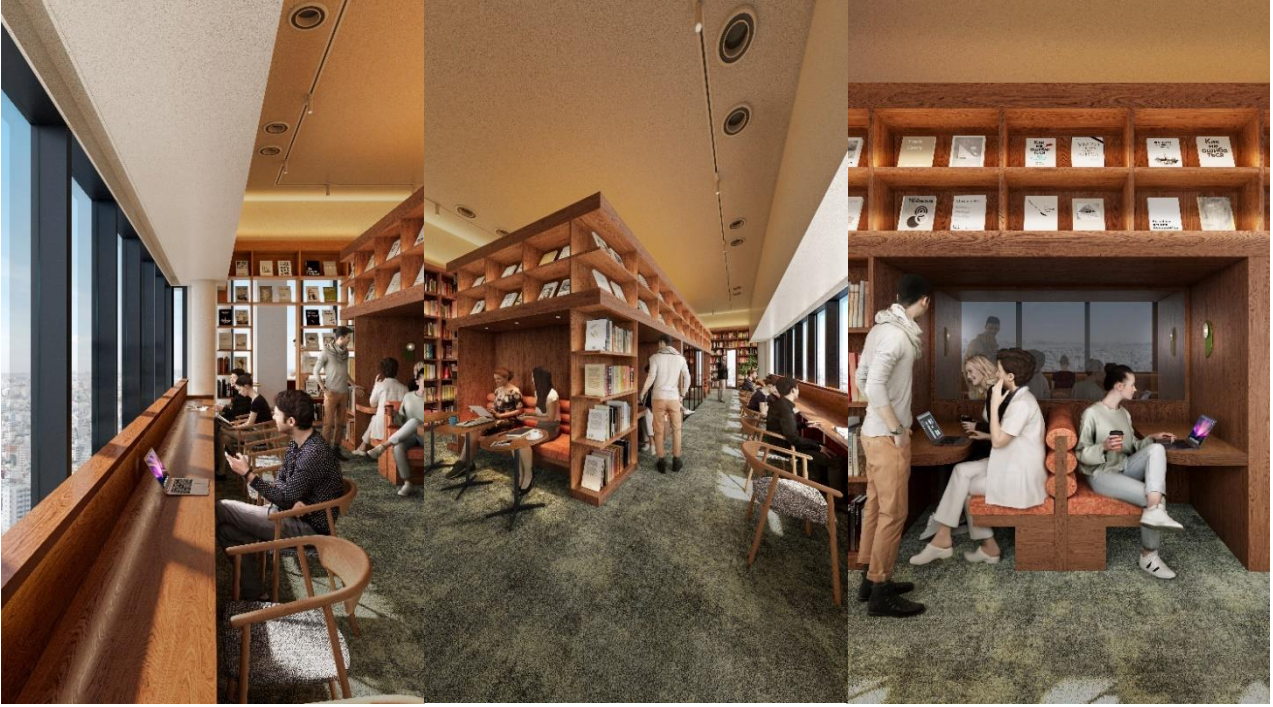
▲ワーキングラウンジ（イメージ）

地上160mからの景色を眺めながらゆったり思索をしたり、静かに集中作業をしたり、仲間と対話をしたりと、思い思いに利用することができる、落ち着いた雰囲気ワーキングラウンジです。約2000冊の書籍を自由に読むことができますので、発想のヒントを探ることができます。毎月さまざまなテーマの新刊を提供します。