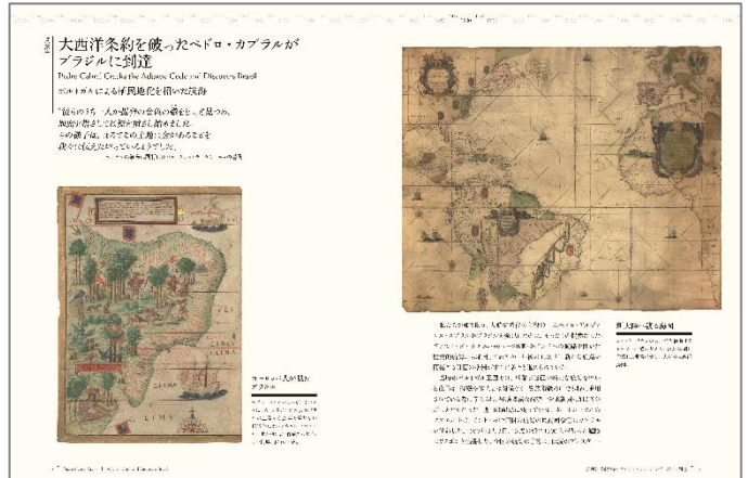
大西洋条約を破ったペドロ・カブラルがブラジルに到達