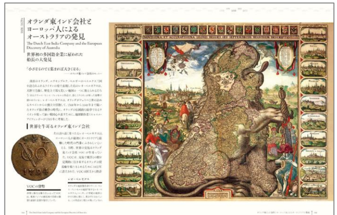
オランダ東インド会社とヨーロッパ人によるオーストラリアの発見