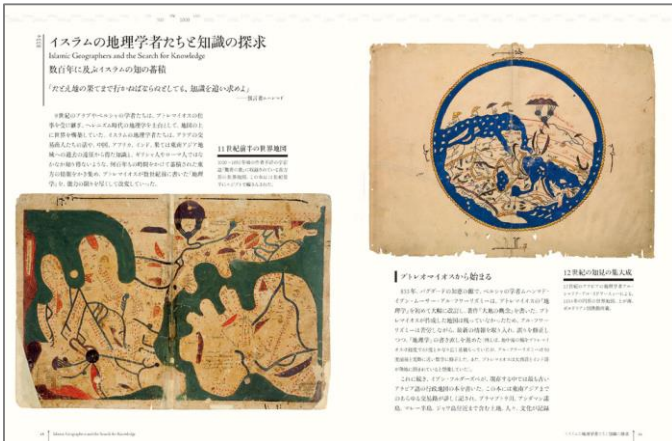
イスラムの地理学者たちと知識の探求