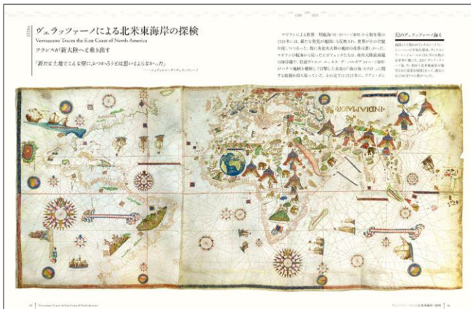
ヴェラツァーノによる北米東海岸の探検