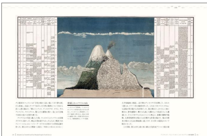
アレクサンダー・フォン・フンボルトとエメ・ボンプランの南米探検