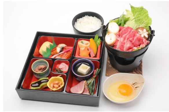
▲峰道レストラン&展望台でのお食事 (イメージ)