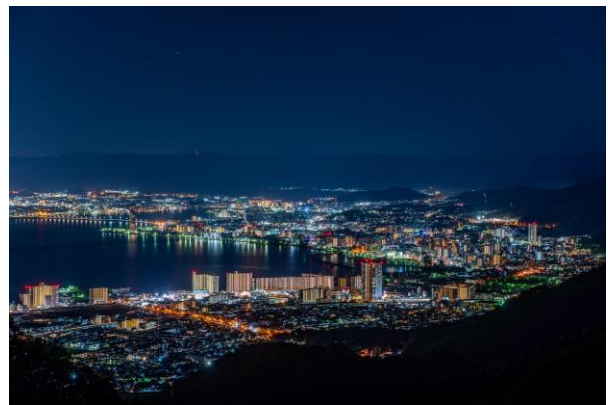
▲比叡山からの眺め(大津市街地方面)