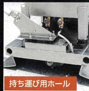
持ち運び用ホール