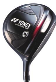
フェアウェイウッド