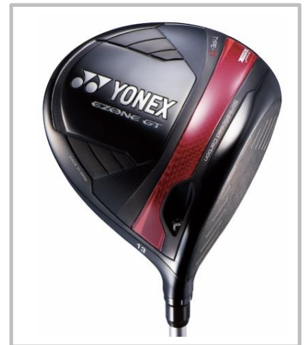
※画像はドライバー