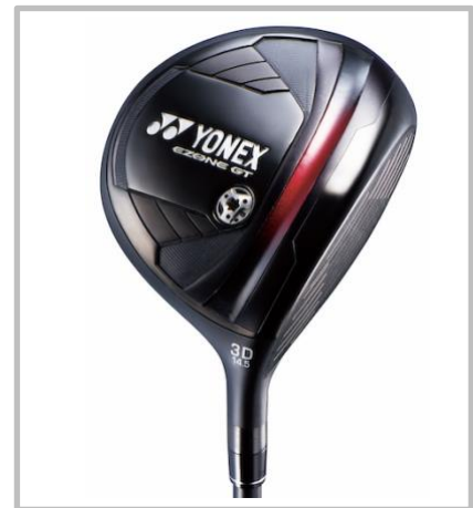
※画像は 3D 番ウッド