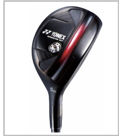
※画像は 5 番ユーティリティ