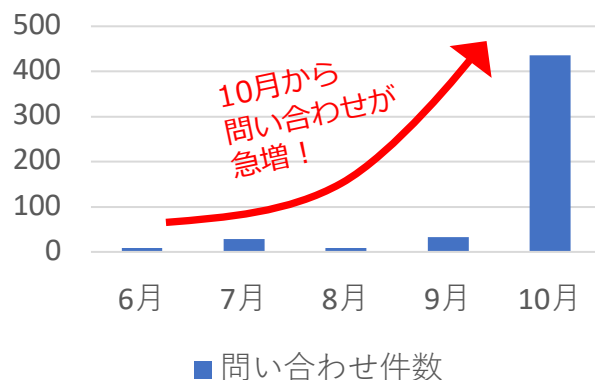
Windows 11関連の問い合わせ件数

Windows 11のリリースが発表された2021年6月より徐々にWindows 11に関するお問い合わせは発生しており、10月の正式リリース以降急増しました。リリース後にどのように対処すればいいのかわからないというユーザーの悩みが数字として表れています。当社はお客さまに安心してパソコンをご利用いただく為にIoTのかかりつけ医としてアップグレードに関する悩みを解消して、新しいOSを安心してご利用いただけるようサポートします。