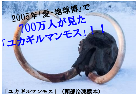
「ユカギルマンモス」(頭部冷凍標本)

報道関係者の皆様におかれましては、本情報および企画展情報のお取り上げをご検討いただけますよう、お願い申し上げます。