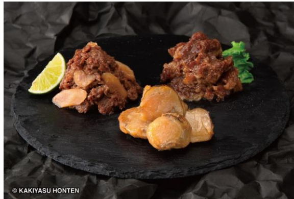
(左)『牛肉ごぼうしぐれ煮』(中央)『帆立うすだき』(右)『減塩 牛肉しぐれ』

この機会に、柿安の職人が丹精込めてお作りした“料亭しぐれ煮”をぜひご賞味ください。