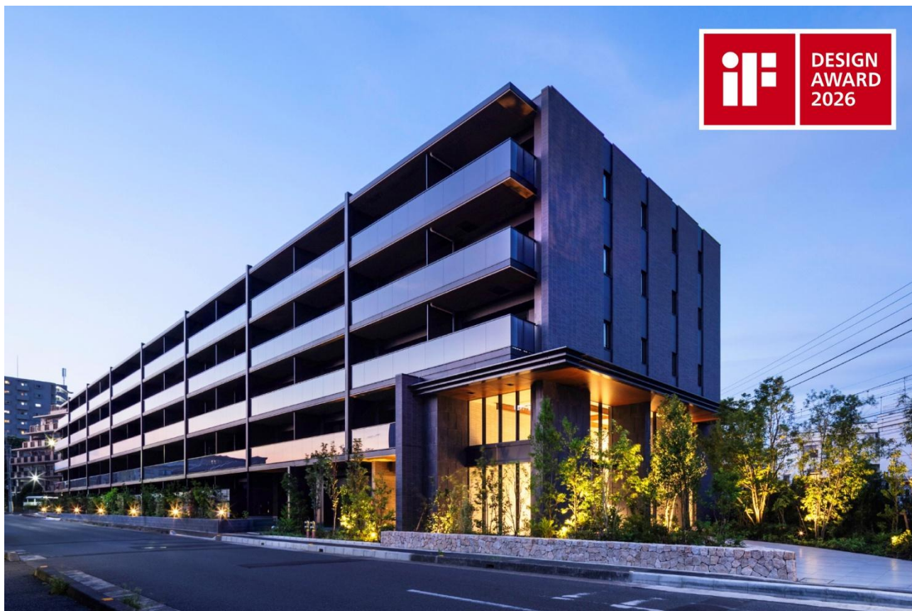
「ファインシティ大宮公園」（埼玉県さいたま市）

併せて、2026年4月27日にドイツ ベルリンで開催された授賞式に企画担当者が出席しました。