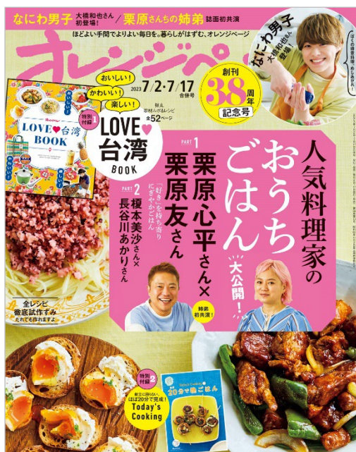
『オレンジページ 7/2-7/17 合併号』

株式会社オレンジページ(東京都港区)が月2回発行する生活情報誌『オレンジページ』は、創刊38周年を迎えます。2023年6月16日(金)発売の記念号では、スペシャル企画が目白押し！なにわ男子の大橋和也さんが誌面初登場で得意料理を披露、人気料理家たちのおうちごはんを大公開、約1200人の読者にきいた繰り返し作る大好きおかずほか、撮り下ろし取材ルポ&レシピも充実の別冊付録「LOVE♡台湾 BOOK」(52ページ)がついて、特別定価 690円(税込)です。