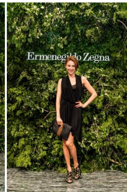
モデル 道端 カレン