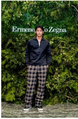
俳優 野村 祐希