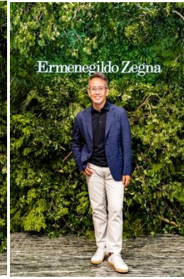
演出家 宮本 亜門