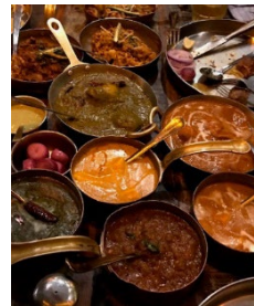
インドでのリサーチの様子

2章 無印のカレー開発秘話—おいしいだけでは売れない(素の食は民藝に置き換えられる／たかが下味、されど下味／本場に出かけたからこそわかったこと／バターチキンの“無印良品的本質”を見つける 他)