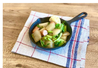
左から、青ネギと牛肉のバジル丼、にんにくと豆のスープ たっぶりのオリーブオイル、大根と白菜のドイツ風ソテー