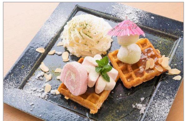
▲見た目が華やかなワッフルはインスタ映えること間違いなし！

※ミエレとは…「はちみつ」と新鮮な食材を組み合わせた料理を満喫できる海辺の白いカフェレストラン http://www.miele-da-scuola.com/