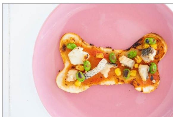
▲わんちゃん島ピザ 淡路島産シーフード

※クラフトサーカスとは…100m を超えるウッドデッキを持つシーサイドマーケット&レストラン https://awajicraftcircus.com/