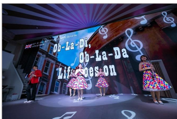
▲懐かしい曲がたくさん聞けます！