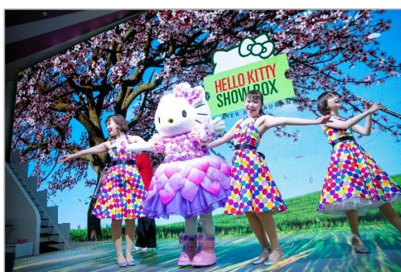
▲ハローキティと一緒に歌って踊ろう！

※HELLO KITTY SHOW BOX とは…施設全体が“驚きに溢れる”をコンセプトにしたお客様に驚きや感動を与えるシアターレストラン https://awajiresort.com/hellokittyshowbox/