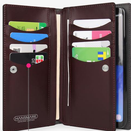
豊富な収納ポケット カードポケット8つ・マルチポケット5つ