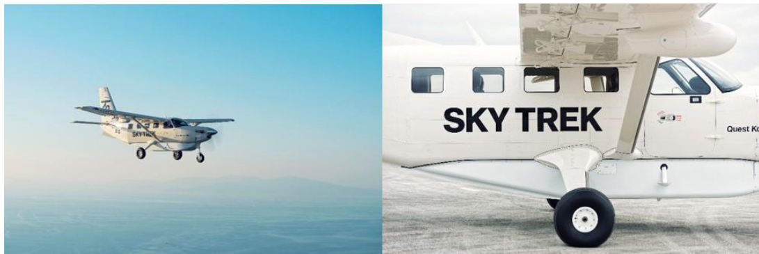
SKY TREK の小型航空機 KODIAK100

株式会社 SKYTREK（本社：東京都港区、代表取締役社長：永堀 敬太）は、小型航空機チャーター SKY TREK のサービスを一新し、2018年10月1日（月）から一般および代理店向けに予約・販売を開始します。これに伴い、サービスや料金のほか オフィシャルウェブサイトを更新します。