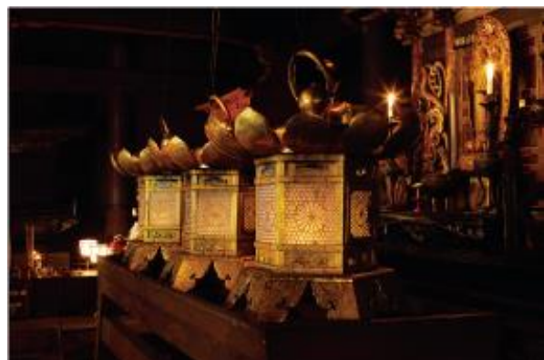
▲1200 年灯り続ける不滅の法灯