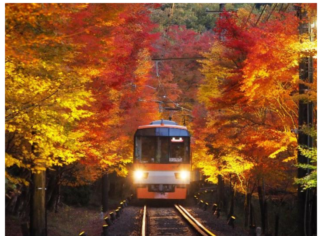
もみじのトンネル