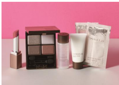
CHARITY PINKY RING Fashion