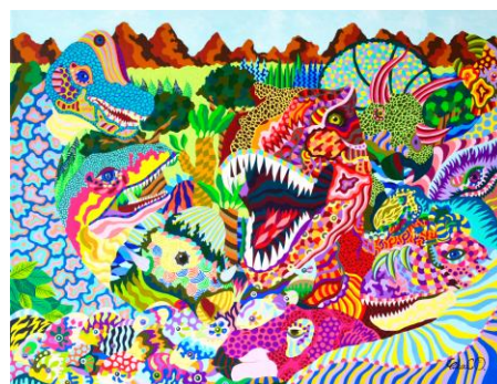
証 - あかし -