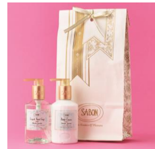
CHARITY PINKY RING Meal