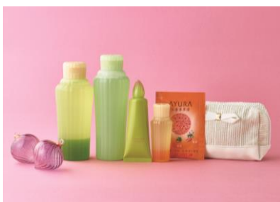
CHARITY PINKY RING Family