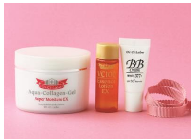
CHARITY PINKY RING Birth