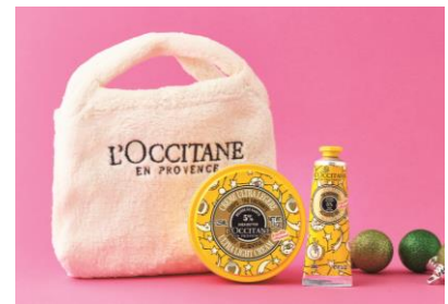
CHARITY PINKY RING Love

<ロクシタン> ジョイフルスター スノーシア デライトフルティーボディケア キット 5,400円